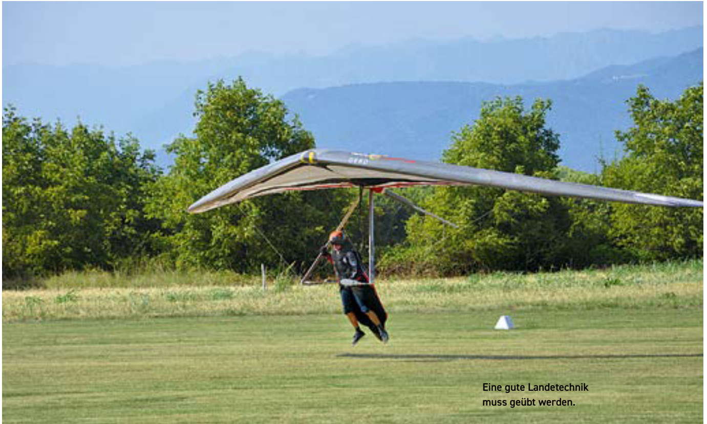
Eine gute Landetechnik muss geübt werden.