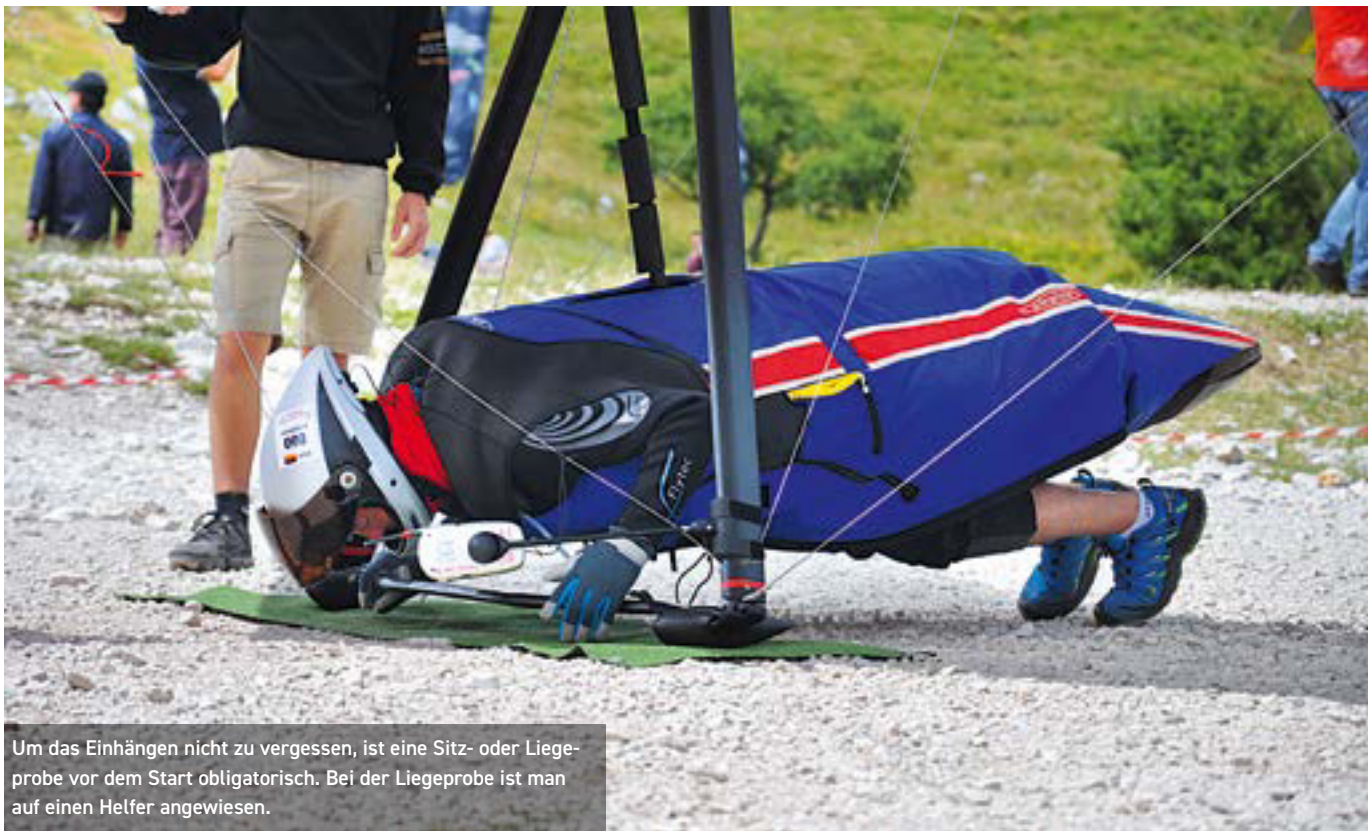
Um das Einhängen nicht zu vergessen, ist eine Sitz- oder Liegeprobe vor dem Start obligatorisch. Bei der Liegeprobe ist man auf einen Helfer angewiesen.