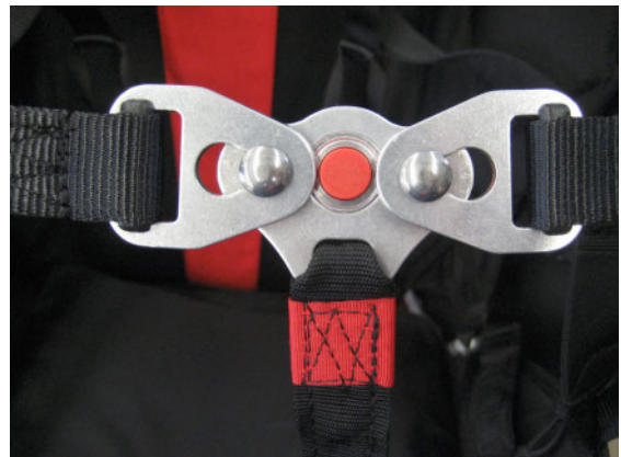
Der korrekt verschlossene Brustgurt

Der Brustgurt wird verschlossen, indem die Brustgurtschnallen auf den Verschlussknopf aufgedrückt werden und nach außen gezogen werden. Der Kunststoffknopf in der Mitte verhindert die Öffnung. Zum Öffnen muss dieser gedrückt werden, nur dann kann die Schnalle Richtung Mitte geschoben und abgehoben werden.