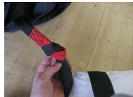
Verbindung Gurtband / Gurtband