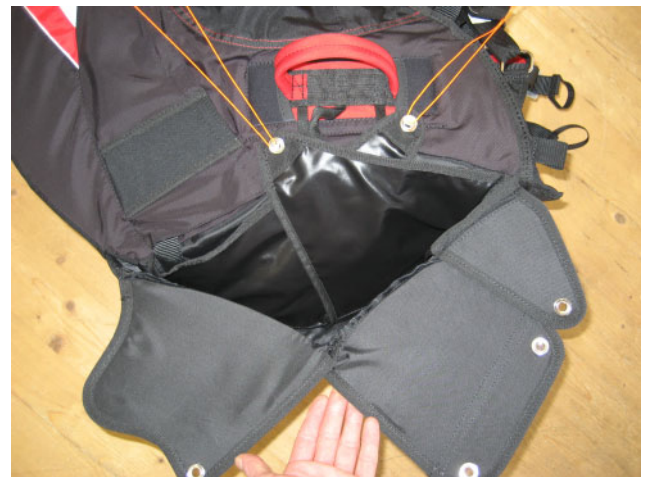
2. Beide Stofflappen wie abgebildet mit den Loops verbinden (überkreuz)