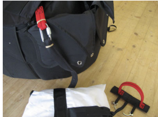
Verbindung mittels Verbindungsglied

Die Gurtbänder sollten auf beiden Seiten des Schraubschäkels mit Gummiringen, oder Fixierband fixiert werden.