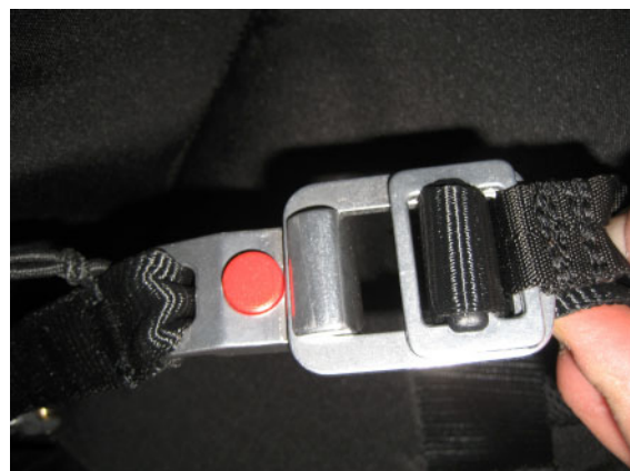
Die korrekt verschlossene Beinschlaufenschließe

Die Beinschlaufen werden dadurch verschlossen, dass die Schnalle in die Nut hinein gezogen wird. Der Kunststoffknopf verhindert die Öffnung der Schnalle. Zum Öffnen der Schnalle muss der Kunststoffknopf gedrückt werden und danach kann die Schnalle aus der Nut geschoben werden.