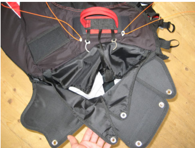
1. Rettungsschirm wie abgebildet verstauen und Packschnüre in die beiden Loops einfädeln

BEFOLGE UNBEDINGT DIE REIHENFOLGE ANHAND DER BILDER!