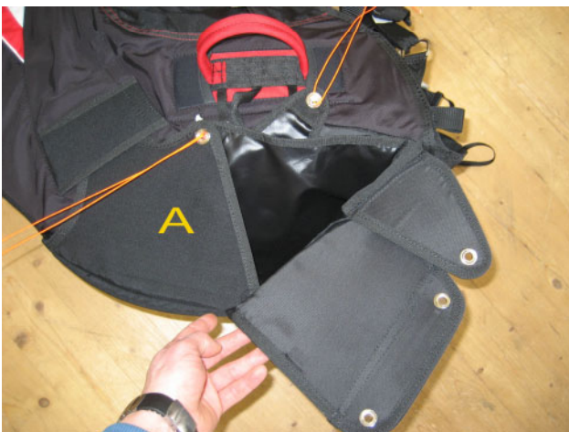
3. Containerklappe A wie abgebildet schließen