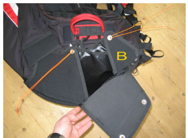
4. Containerklappe B wie abgebildet schließen